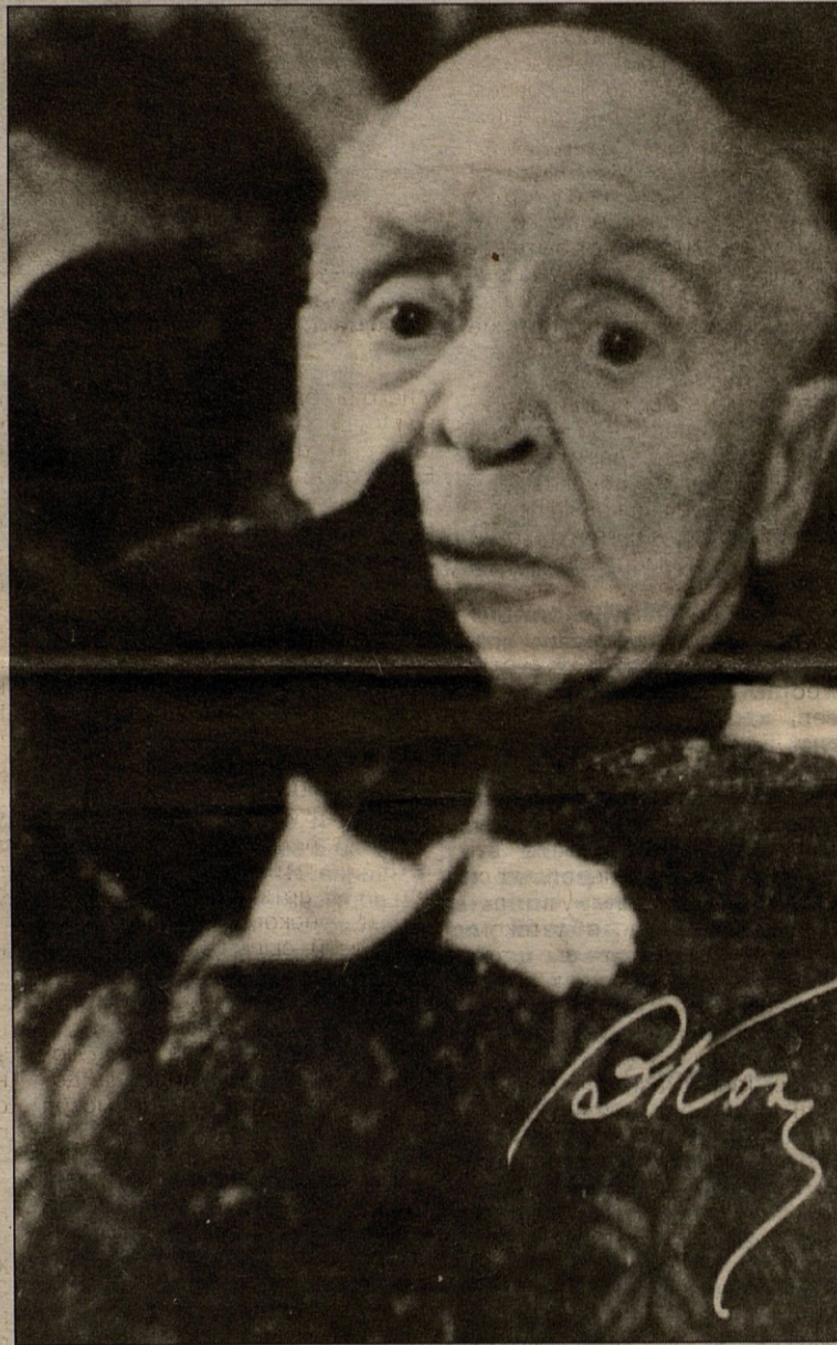
Козин тяжело перенес смерть любимого кота Мосика

- Репертуар у меня другой. Вот есть песня о Ленине на стихи Демьяна Бедного. А вообще благодарственные гимны - не мой